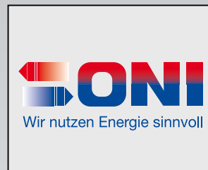
Kälte-, Klima- und Temperiergeräte