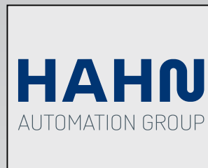
Handlinggeräte, Handhabungs- elemente, Einlegeautomaten