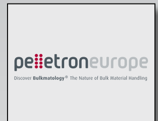
Entstaubung von Schüttgütern